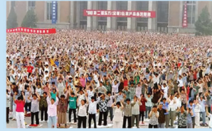
Tp. Thẩm Dương (trước năm 1999)

Là môn tu luyện ôn hòa, phi chính trị, mang lại nhiều lợi ích cả thân lẫn tâm nên Pháp Luân Công đã nhận được sự ủng hộ của đông đảo quần chúng nhân dân và giới quan chức trong Đảng Cộng sản Trung Quốc (ĐCSTQ). Chỉ sau vài năm ngắn ngủi kể từ ngày được chính thức công bố, Pháp Luân Công đã vô cùng phổ biến ở Trung Quốc. Vào cuối những năm 1990, theo thống kê của Chính phủ Trung Quốc có khoảng 70 -100 triệu người theo học pháp môn này.