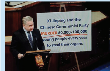
Nghị sỹ Chris Smith phát biểu tại Hạ viện.

Ngày 27 tháng 3 năm 2023, Hạ viện Hoa Kỳ đã thông qua dự luật H.R. 1154, Đạo luật Chấm dứt nạn Cưỡng bức Thu hoạch Nội tạng. Dự luật này nhằm trừng phạt những người tham gia vào hoạt động thu hoạch nội tạng sống của ĐCSTQ từ tù nhân lương tâm, đặc biệt là các học viên Pháp Luân Công và người Duy Ngô Nhĩ.