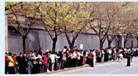
Hình ảnh các học viên đứng ôn hòa trật tự thỉnh nguyện, không mang theo biểu ngữ (ngày 25 tháng 4 năm 1999).

Đến năm 2009, hai Luật sư nhân quyền nổi tiếng là David Kilgour và David Matas xuất bản cuốn "Thu hoạch Đẫm máu: Thu hoạch nội tạng của các học viên Pháp Luân Công tại Trung Quốc" (Bloody Harvest) đã phơi bày rõ nạn mổ cướp nội tạng sống từ các học viên Pháp Luân Công do ĐCSTQ hậu thuẫn, trong đó có đến hàng triệu người đã bị giam giữ hoặc bỏ tù chỉ vì đức tin của mình.