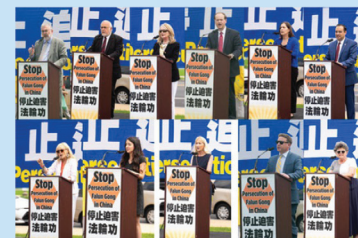
Các diễn giả trong cuộc mít-tinh tại National Mall ngày 20 tháng 7.

Chi tiết xem tại: https://bit.ly/3mltwi9