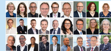
Các quan chức chính phủ trên toàn thế giới lên tiếng ủng hộ Pháp Luân Công.