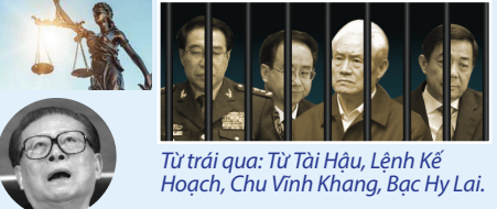
Từ trái qua: Từ Tài Hậu, Lệnh Kế Hoạch, Chu Vĩnh Khang, Bạc Hy Lai.

Giang Trạch Dân, dù đã chết nhưng vẫn có thể bị truy tố trước công lý vì "Di sản đồ sộ" về những tội ác đã gây ra. https://bit.ly/3TylqXn